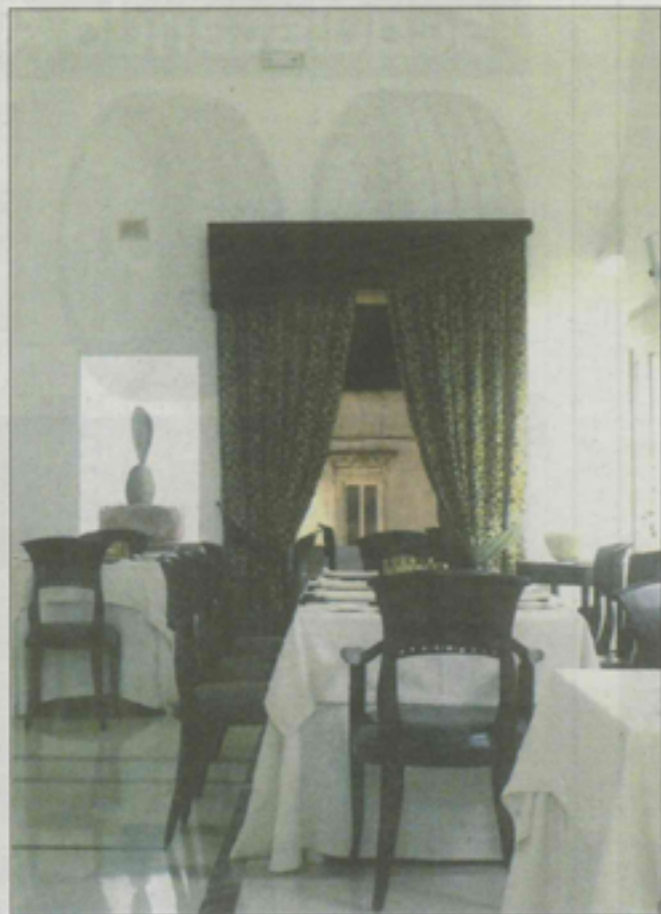
Il ristorante Già sotto l'arco di Carovigno

Settanta strutture brindisine si aggiudicano il marchio di "ospitalità italiana". La Camera di commercio di Brindisi, d'intesa con l'Azienda speciale Isfores ed in collaborazione con Isnart - Istituto nazionale ricerche turistiche, ha realizzato nell'ambito del Fondo di Perequazione Unioncamere 2007 il Progetto "I prodotti turistici del Made in Italy". Ieri nella sede dell'ente camerale la cerimonia per il conferimento del marchio. La valutazione del rispetto di specifici criteri di qualità è stata rimessa ad un gruppo di esperti, facenti parte di un organismo terzo e indipendente, che hanno valutato gli aspetti ritenuti più rilevanti per la soddisfazione degli ospiti: facilità di accesso, parcheggio, professionalità e ospitalità del personale, pulizia e funzionalità delle camere, genuinità dei prodotti, trasparenza dei menù, sostenibilità ambientale. Il Marchio ha validità annuale, rinnovabile e rappresenta un qualcosa di più di un semplice logo di riconoscimento, consentendo alle strutture ricettive di poter godere di un vero e proprio alleato della qualità.